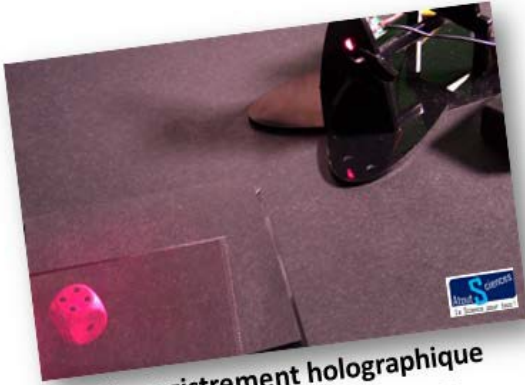
L'enregistrement holographique en moins de 3 min chrono

Pictures with captions (curve, photo, scheme ...):