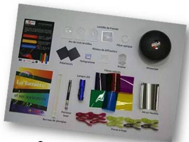
Contenu du kit LightBox